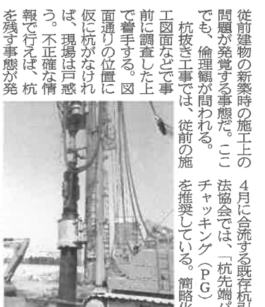
金長を抱え込み、引き抜くP工法